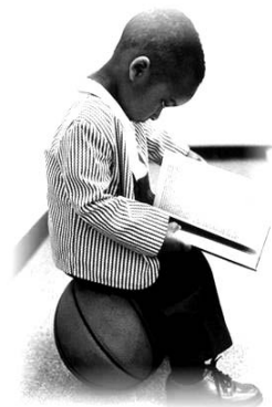
පිටුව - 35

1882දී ප්‍රථම වරට සංචාරක එංගලන්ත කණ්ඩායමක් සමග ගාලුමුවදොර පිටියේදී තරග වැදීමට සමස්ත ලංකා පිළට හැකි වූයේ නැව් අනතුරක් නිසා පහළ වූ වාසනාවකිනි. ඕස්ට්‍රේලියාව බලා යමින් තිබූ එංගලන්ත ක්‍රිකට් කණ්ඩායම රැගත් නැව් මොහොතකට කොළඹ වරායේ නවතා යළි ගමන් අරඹන්නේ පෞවෝර් නමැති එම නැවට පැමිණි අනතුරත් නිසා ආපසු ඊට සිදු විය.