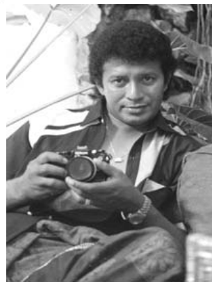
පිටුව - 7

සිංහල සිනමාවේ මේ අසහාය නළුවා මෑත කාලීන ශ්‍රී ලංකාවේ දේශපාලන ක්ෂේත්‍රයෙහිදී අතිශයින්ම ජනප්‍රිය චරිතයක් වූයේය. කුඩා කල සිට පැවති මානව හිතවාදී බවෙහි ප්‍රතිඵලයක් වශයෙන් 1977දී පැවති මහ මැතිවරණයේදී කටාන ආසනයේ ශ්‍රී ලංකා නිදහස් පක්ෂ අපේක්ෂකයා වශයෙන් දේශපාලනයට පිවිසි ඔහුට එදා පැවති එජාප රැල්ලට යට වෙමින් පරාජය වන්නට සිදු විය.