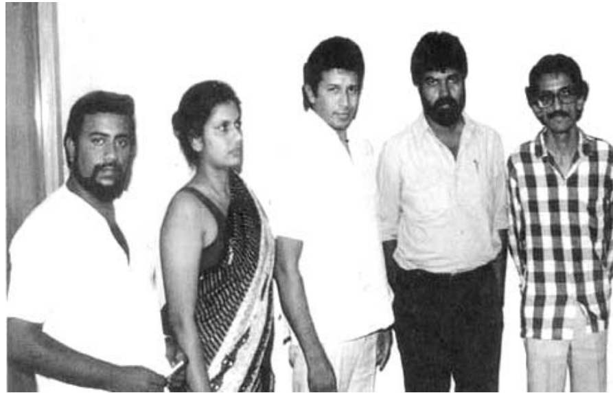
1986දී ශ්‍රී ලංකා මහජන පක්ෂ නායක විජය කුමාරතුංග, වන්දිකා සහ ඔසි අබේගුණසේකර ඇතුළු පිරිස මදුරාසියේදී EPRLF නායකයන් හමු වූ අවස්ථාව