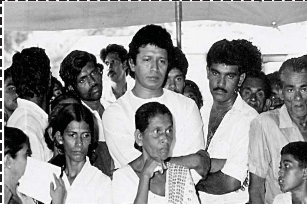
විජය සාමාන්‍ය මහජනයා සමග ගැවසීමට අතිශය ප්‍රිය කළ පුද්ගලයෙකි. දේශපාලන රුලියක් අතරතුර විජය මිහිසන් අතරට ගිය අවස්ථාවක්

තවත් ආලෝකවත් කළපහන් තරු දෙකක් බඳු විය. ඔහු සිරගෙදර සිටි අවදියේ සිහිනි දරුවන් වෙත ලිපි ලියා එවූ බවද නොරහසකි. ඔහුගේ අවසන් මොහොතේදීද ඔහු දැනේ තිබුණේ සිහිනි දියණිය යශෝධරාවන් විසින් ඇදී සිතුවමකි. විජය තම දරුවන්ට පන මෙන් ආදරය කළ පියෙකි. තම මෑණියන්ට පන මෙන් ආදරය කළ පුතෙකි. ශ්‍රී ලංකාවේ සෑම කල්හිම සිදුවන්නේ අයුක්තිය අසාධාරණය වෙනුවෙන් කැප වූවන් ඝාතනයෙන් මර්ධනය කිරීමය. මේ න්‍යායයට අනුව ජාතික නායකයකු බවට පත් වූ විජය කුමාරතුංගයන් අමාත්‍ය ලෙසින් ඝාතනය කෙරිණි. විජයට ගිනි අවිය එල්ල කළ ඝාතකයා සොයා ගත් නමුත් තවමත් මේ අවිහිංසක සමනලයා මරා දැමූ නියම ඝාතකයන් කවුරුන්දැයි අනාවරණය වී නොමැත. එසේ වුවද එය බලය මූලික කොට ගත් තවත් ඝාතනයක් බව නම් පැහැදිලියේය.