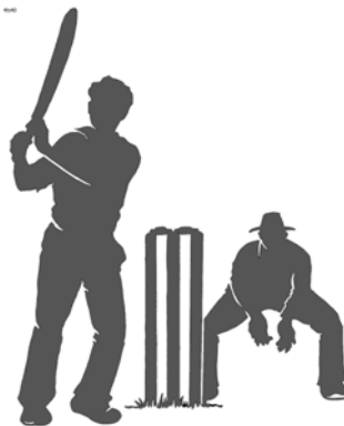
පිටුව - 13

සිංහල සිනමාවේ මේ අසහාය නළුවා මෑත කාලීන ශ්‍රී ලංකාවේ දේශපාලන ක්ෂේත්‍රයෙහිදී අතිශයින්ම ජනප්‍රිය චරිතයක් වූයේය. කුඩා කල සිට පැවති මානව හිතවාදී බවෙහි ප්‍රතිඵලයක් වශයෙන් 1977දී පැවති මහ මැතිවරණයේදී කටාන ආසනයේ ශ්‍රී ලංකා නිදහස් පක්ෂ අපේක්ෂකයා වශයෙන් දේශපාලනයට පිවිසි ඔහුට එදා පැවති එජාප රැල්ලට යට වෙමින් පරාජය වන්නට සිදු විය.